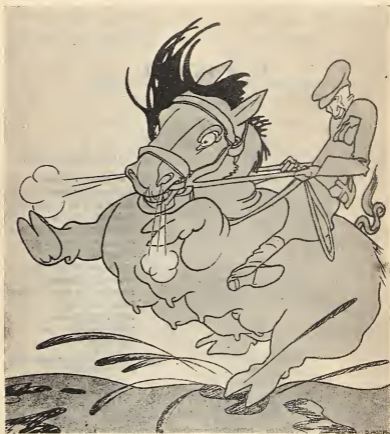
Рис. Д. Моора.

Конструируется новое коалиционное министерство. (Из газет.)